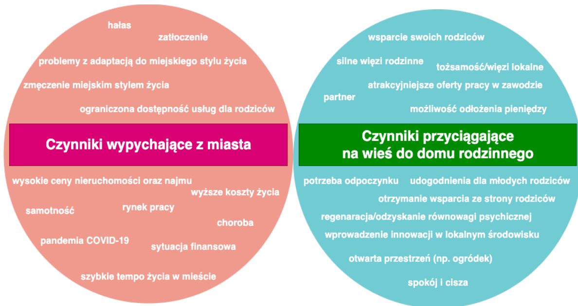
Rysunek 3. Czynniki wypychające z miasta oraz przyciągające na wieś do domu rodzinnego.