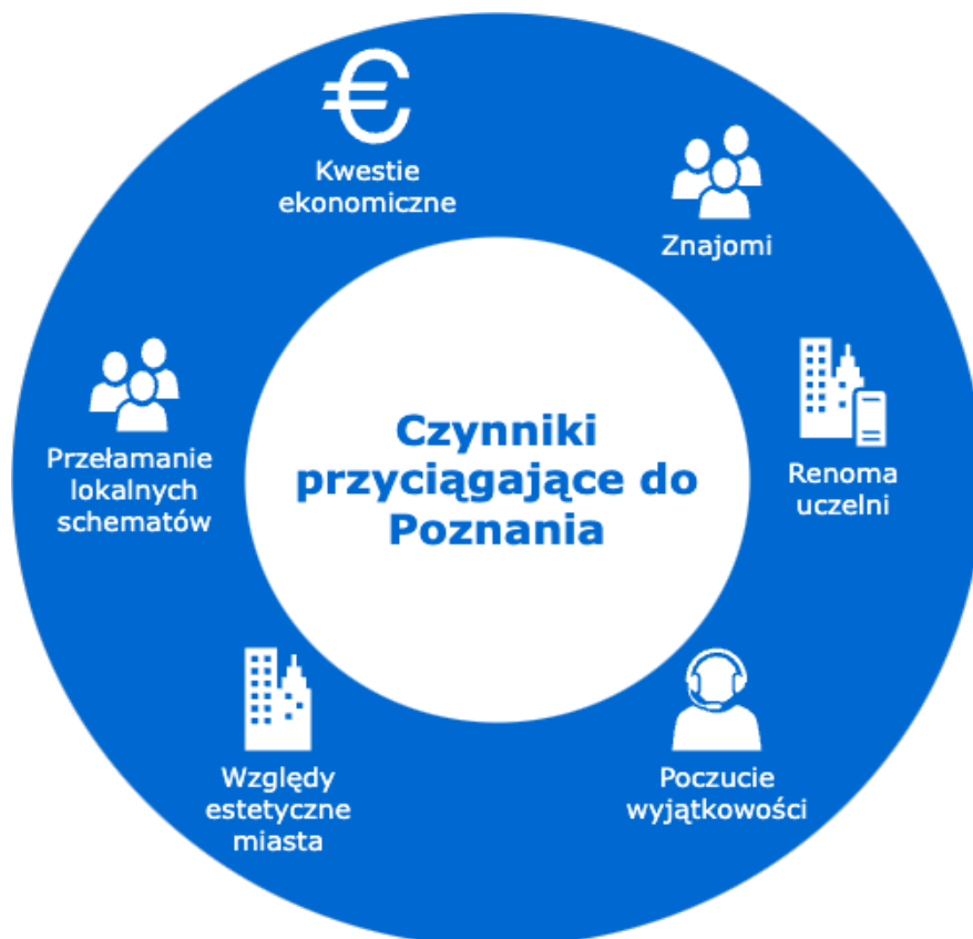
Rysunek 1. Czynniki przyciągające badanych do Poznania.