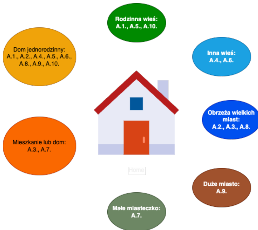
Rysunek 5. Plany absolwentek związane z miejscem przyszłego zamieszkania.