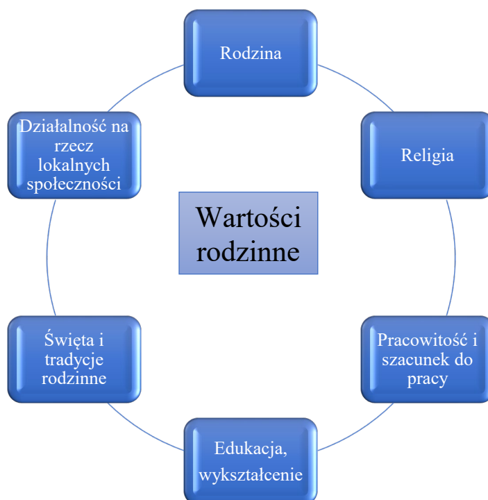
Rysunek 2. Wartości rodzinne absolwentek.