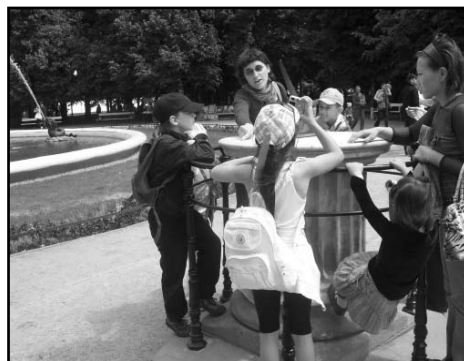
Uczestnicy rajdu w Parku Saskim