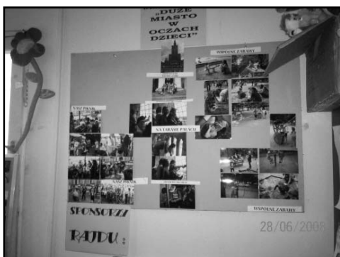
Wystawa w ośrodku na Siekierkach