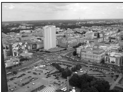
Widok z Pałacu Kultury i Nauki