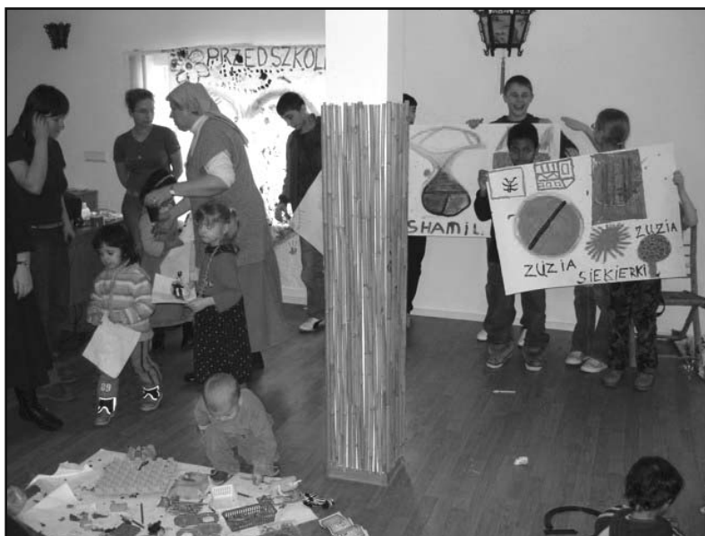
Dzieci w ośrodku na Siekierkach 1

Dzieci uchodźców, do których skierowany był projekt, są kilku narodowości (Rosja, Dagestan, Kirgistan, Gruzja, Mongolia, Białoruś, Ukraina) i przebywają w ośrodku razem z rodzicami, którzy starają się uzyskać na terytorium Polski status uchodźcy lub azyl. Starsze z nich podczas roku szkolnego chodzą do dzielnicowej Szkoły Podstawowej nr 3, a niektóre z młodszych do przedszkola. Jednak poza zajęciami szkolnymi w ośrodku nie ma ani miejsca, ani osób, które przeprowadzałyby dla nich regularne zajęcia. Matki wychodzą z ośrodka, gdyż często starają się znaleźć jakąś okazjonalną pracę w ciągu dnia. Dlatego z wielką ulgą i radością przysyłają swoje pociechy na nasze spotkania do małej wygospodarowanej i wyekwipowanej salki, szumnie mianowanej „przedszkolem”. Jednak w tej sali jest zbyt mało miejsca dla 17 ruchliwych dzieci.