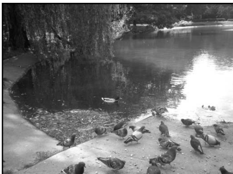
Zdjęcie wykonane przez uczestnika w trakcie rajdu