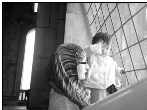
Uczestniczki rajdu na tarasie widokowym