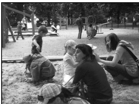
Uczestnicy rajdu w Parku Saskim